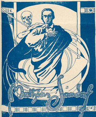
Mathias Sandorf au Royal