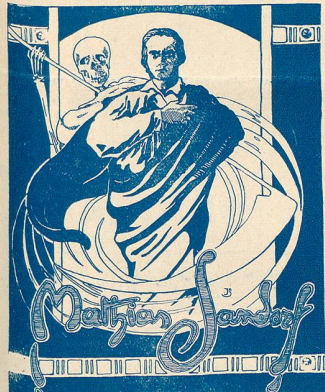
Mathias Sandorf au Royal

Je ne sais rien de plus exécrable que ces imitateurs. Si vous êtes incapable de rien produire par vous-même, n'essayez pas de briller des rayons de gloire volés à d'autres, en essayant d'imiter l'imitable Charlie, vous n'êtes plus comique, vous êtes ridicule.