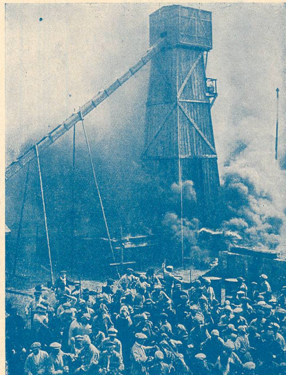
L'incendie du puit à pétrole dans La Terre promise .

La conclusion de l'œuvre s'appuie sur une très