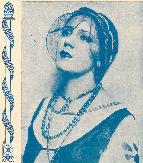
Raquel Meller dans La Terre Promise .

d'Henry ROUSSEL avec RAQUEL MELLER au Cinéma du Bourg.