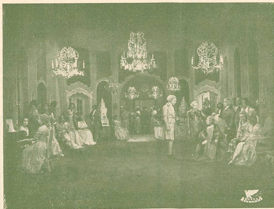
Une Scène de Cendrillon

Mme Bricoli, qui voudrait marier une de ses