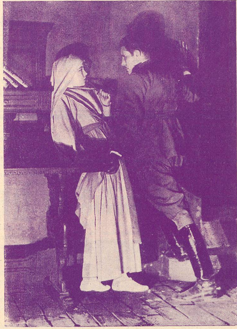
Une scène de Sœur Blanche.