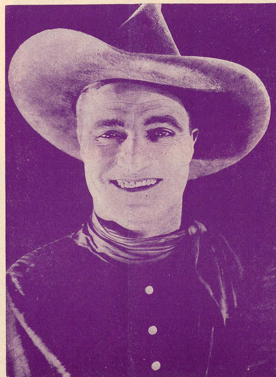
Le célèbre cow-boy TOM MIX vient d'arriver à Paris avec son cheval Tony ; on lui a fait une réception des plus enthousiastes.