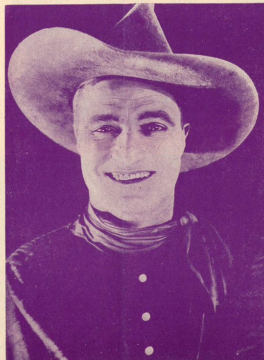
Le célèbre cow-boy TOM MIX vient d'arriver à Paris avec son cheval Tony ; on lui a fait une réception des plus enthousiastes.