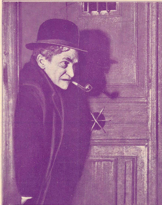
Une scène du film L'Hôtel Potemkine qui passe cette semaine au Modern-Cinéma à Lausanne.

tre en scène » l'épisode de l'hôtel Potemkine et faire naître des sentiments qui détourneraient le jeune désabusé de ses tragiques desseins.