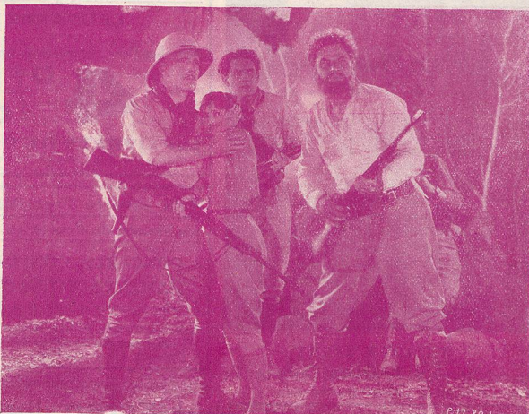
Lewis Stone, Bessie Love, Lloyd Hughes, Wallace Beery. Les chasseurs se frayent un chemin dans les forêts de l'Amazone.