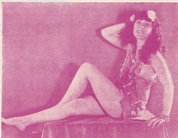
Virginia Browne Fair, la „Beauté Tropicale“.