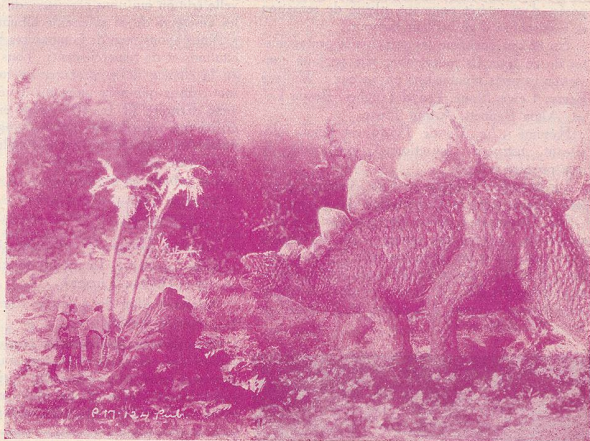
Un spécimen de Dinosaur dans les forêts de l'Amazone.