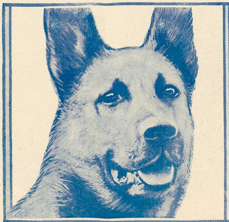
Strongheart in The Love Master