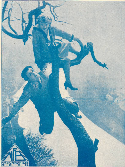
Une scène du film MISTER RADIO