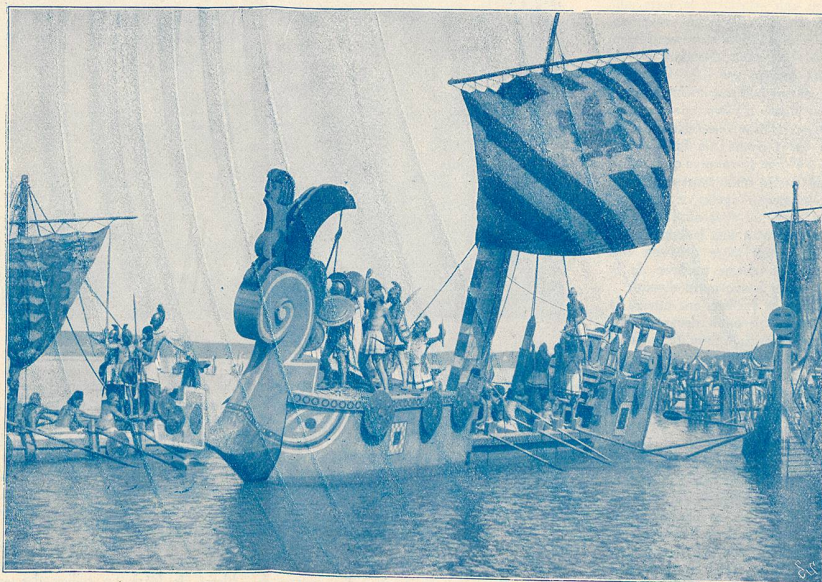
Scène de LA PRISE DE TROIE (la flotte grecque).

Une colombe blanche lâchée par les déesses devait le conduire à son idéal. Justement on