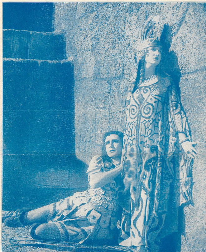
WLADIMIR GAIDAROV dans le rôle de Paris.