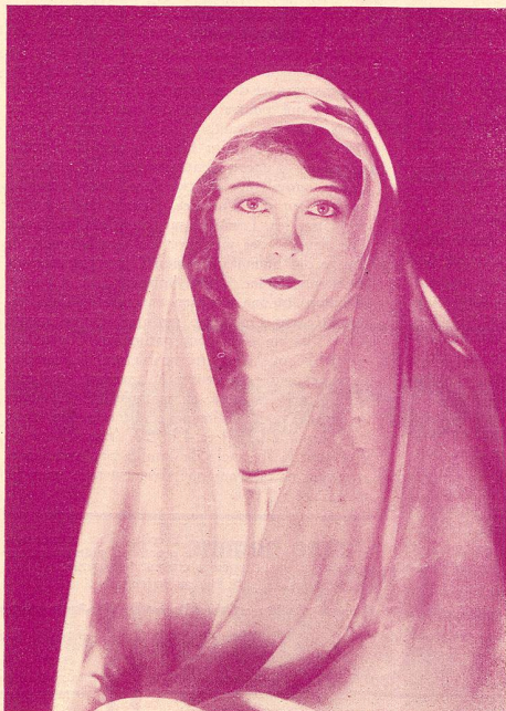
LILIAN GISH dans «La Sœur Blanche»

Son succès fut retentissant. Dans cette œuvre, comme dans tout son théâtre, l'auteur porte à la scène un sujet qui prête aux discussions philoso-