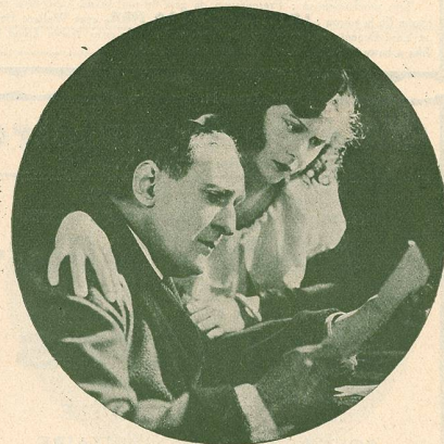
Une scène de L'ARRIVISTE