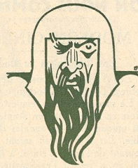
HAGEN DE TRONEJE

La première partie de l'œuvre a pour titre « Siegfried » ; elle décrit la vie et les aventures de ce prodigieux héros, comment il forgea la fameuse épée Balmung et tua le Dragon ;