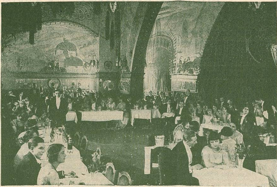
Une scène de L'ARRIVISTE

Mais la justice immanente incarnée dans Chénard, un juge d'instruction perspicace, le guette depuis longtemps, il finit par le confondre avec l'aide d'un bon curé. La vérité triomphe et la justice aussi. N'est-ce pas moral ?