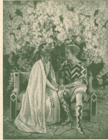
Une scène des NIBELUNGEN