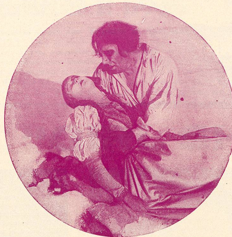
Il prend la jeune fille dans ses bras et déjà ses lèvres s'avancent vers les lèvres exangues de l'enfant, mais il sursaute, ce n'est qu'un cadavre qu'il serre dans ses bras.

Alors, il veut jeter le corps par-dessus le traîneau, mais les jambes du cadavre sont prises dans le marchepied et le corps inanimé de la malheureuse fille est traîné dans la neige à une allure folle.