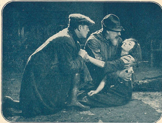
Le chatelain et Aubertel le piqueur, qui aimait secrètement Marielle, surviennent et la trouvent presque privée de raison, hébété devant le cadavre du misérable qu'elle aimait.