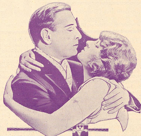
Corinne Griffith and Conway Tearle in "Lilies of the Field"

LA MEILLEURE PELLICULE NÉGATIVE ASTRA POSTIVE LA MOINS CHÈRE M. SAUTY & C e , GENÈVE 58, Rue de Carouge, 58