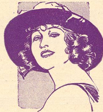
Betty Compson in the Paramount Picture The White Flower

Née au bord du lac Salé, Betty, pour augmenter les maigres ressources de sa famille, jouait du violon dans un petit théâtre. Un soir, une attraction manqua, le directeur à court de programme demanda à Betty de jouer un solo de violon.