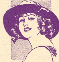
Betty Compson in the Paramount Picture The White Flower

Née au bord du lac Salé, Betty, pour augmenter les maigres ressources de sa famille, jouait du violon dans un petit théâtre. Un soir, une attraction manqua, le directeur à court de programme demanda à Betty de jouer un solo de violon.