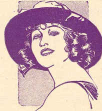
Betty Compson in the Paramount Picture The White Flower

Née au bord du lac Salé, Betty, pour augmenter les maigres ressources de sa famille, jouait du violon dans un petit théâtre. Un soir, une attraction manqua, le directeur à court de programme demanda à Betty de jouer un solo de violon.