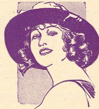
Betty Compson in the Paramount Picture The White Flower

Née au bord du lac Salé, Betty, pour augmenter les maigres ressources de sa famille, jouait du violon dans un petit théâtre. Un soir, une attraction manqua, le directeur à court de programme demanda à Betty de jouer un solo de violon.