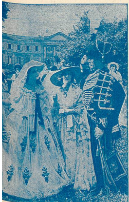
Une scène de Violettes impériales.