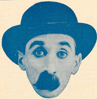
CLYDE COOK dit DUDULE