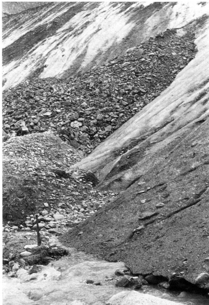
Fig. 4. Abgerutschte Obermoräne am Steingletscher (Sustenpass).

Für die Geländearbeit ist die sedimentologische Trennung von Obermoränen und Eisrandschwemmkegeln bedeutsam; denn oftmals rutschen ganze Obermoränenfelder, teilweise im Verband, vor den Eisrand herab. Solches kann am Morteratsch- und Steingletscher, aber auch am Steinlimmigletscher beobachtet werden (Fig. 4). Dabei entstehen Gebilde, die einander sich überlagernden, zusammengesetzten Eisrandschwemmkegeln ähnlich sind. Es handelt sich um zum Eisrand parallelverlaufende Wälle oder Hügelzüge. Da diese Bildungen aus vollständigem Obermoränenmaterial bestehen, müssen ihre Sedimentparameter mit denen der Obermoräne