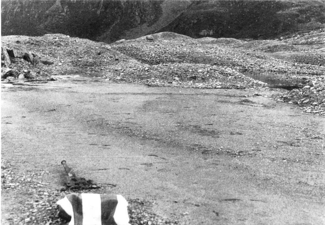
Fig. 1. Eisrandschwemmkegellandschaft im Vorland des Porchabellagletschers (Graubünden).