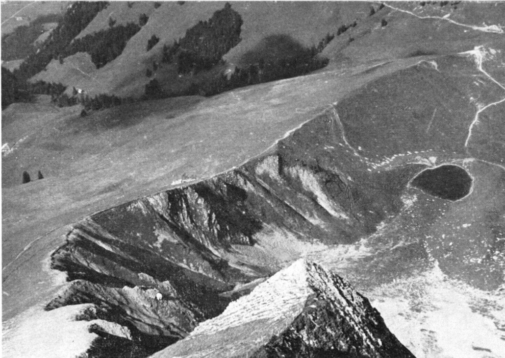
Fig. 42. Crête morainique séparant le glacier de la Riggisalp de celui descendant de la Schwarze Fluh. A droite, le lac de Oberhaus accumulé derrière un vallum. Pied Nord des Metzgertritten.

Dans les calcaires plaquetés de l'Alp Kaiseregg et de Luchernalp, le karst se manifeste par de gros entonnoirs circulaires ouvrant sur des cavernes et des puits dont