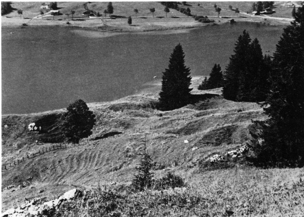
Fig. 43. Dolines dans le gypse de l'anticlinal Charmey-Lac Noir.