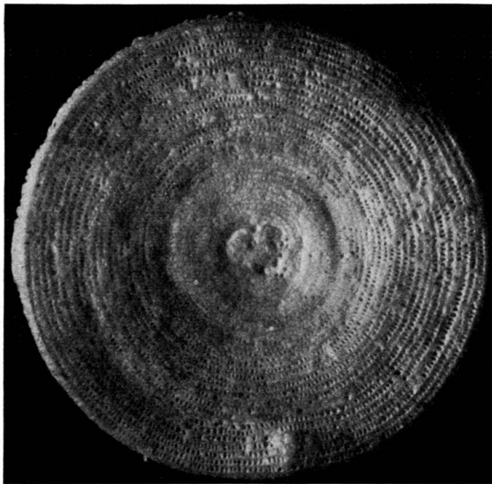
Fig. 41. Marginopora vertebralis QUOY und GAIMARD, Nai. Schalenansicht. Vergr. \times 15 . C 15356.

Im Gegensatz zu den früher besprochenen Formen besitzen die Marginoporen zwei Nebenkammerlagen. Wir nennen die Kammern entsprechend Haupt- und Nebenkammern und die Kämmerchen Haupt- und Nebenkämmerchen. Die Hauptkammern sind wie beim Orbitolites angeordnet, aber die Struktur ist etwas unregelmässiger und wirkt dadurch nicht so formschön. Auf den beiden Seiten der Hauptkammerlage verläuft je ein Annularkanal, der die Kämmerchen einer Hauptkammer miteinander verbindet.