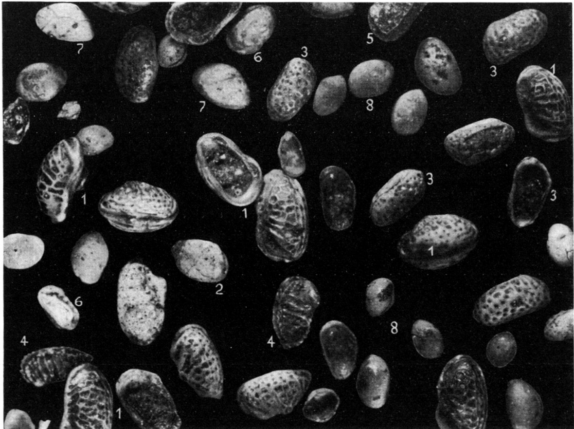
Fig. 3. Marine Ostrakodenfauna von BD 195.

Salinitätsschwankungen tragen. – Wir glauben, dass hier die Thanatocönosen tatsächlich die biologische Faunenzusammensetzung widerspiegeln. Denn unsere Faunen haben alle einen ziemlich reinen Aufbau: im oligo-miohalinen Bereich zum Beispiel fehlen marine Ostrakoden-Arten (mit Ausnahme einer einzelnen allochthonen Progonocythere blakeana ) wie auch Foraminiferen vollständig; umgekehrt zeigten sich im marinen Milieu nirgends Cyprideis ?-Formen, einzig fanden sich in zwei Proben ganz vereinzelt Oogonien. Im Falle massiver Zusammen-