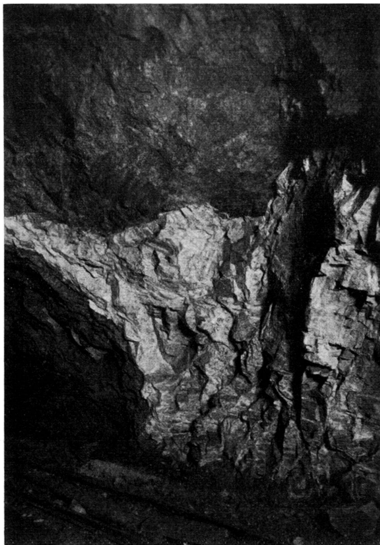
Fig. 3. Quarzporphyritgang (weiss) mit auskeilender Apophyse in brekziösen, verfältelten und verruschelten Mylonitschiefern (dunkel).

Der schmale Gang bei 636 m sendet in diese aufgelockerte Randpartie eine auskeilende Apophyse (Fig. 3). Bei 700 m steckt in den verharnischten Schiefergneissen, ganz nahe am Kontakt mit dem hangenden Porphyritlagergang, eine Linse von massigem Hornblende-Zoisitfels (in Fig. 2 nicht eingezeichnet). Auf die Porphyritgänge folgt wiederum stark verharnischter Schiefergneis, der bis zum Nordportal anhält und auch weiter nördlich in Anrissen längs der Bahn