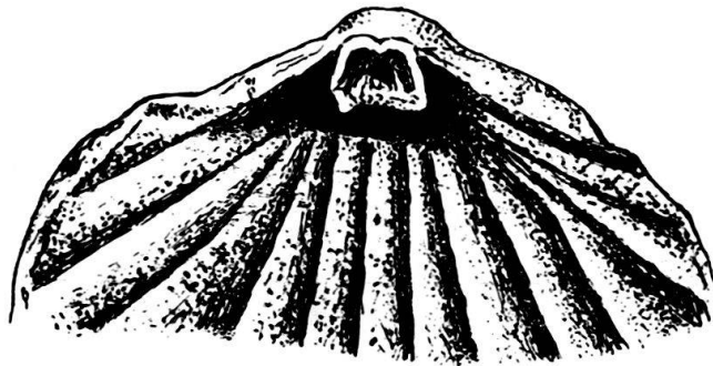
Fig. 3. Misolia asymmetrica n. sp. Exemplar d. Dorsalschale von innen. \times 6 .

eine vom Wirbel der Dorsalklappe schräg zur Ventralklappe einfallende Schlossplatte einschliessen. Ein Medianseptum ist nicht vorhanden.