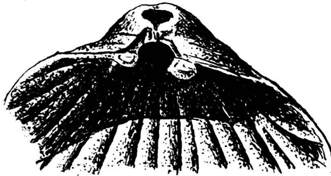
Fig. 2. Misolia asymmetrica n. sp. Exemplar a (Holotyp). Ventralschale von innen. \times 6 .

Artdiagnose: Kleine bis mittelgrosse Art, asymmetrisch, beide Klappen mässig gewölbt, in der Querrichtung stärker als in der Längsrichtung. Umriss gerundet fünfseitig. Schnabel breit, mässig bis schwach gekrümmt, weit vom Schlossrand abstehend. Schlossrand beiderseits des Wirbels ungleich lang. Der Sinus nur wenig tief, der Wulst schwach; beide asymmetrisch angelegt. Radialverzierung aus kräftigen, gerundeten, durch tiefe Furchen getrennten Hauptrippen und einigen wenigen Sekundärrippen bestehend, welche letztere auch fehlen können. Zahl der Rippen am Stirnrand 9–17. Konzentrische Verzierung aus groben Anwachsstreifen. Schale ziemlich dick, faserig, lamelliert, nicht punktiert. Schlosszähne kräftig, Schlossplatte trapezförmig. Muskeleindrücke auf den Schalenflächen nicht beobachtet. Armgerüst unbekannt (nicht erhalten).