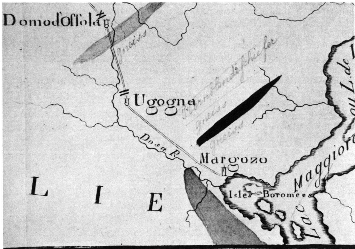
Fig. 2. Nicht eingefärbte, mit Bleistift eingetragene Formationen (siehe Tafel).

Im Gebiet mit Granit, Gneiss (rosa) sind mehrere linsenförmige kleinere Formationen nicht eingefärbt, sondern mit Bleistift eingezeichnet. Folgende Begriffe werden hier verwendet: Gneiss (3×) Dolomie (2×), Hornblendeschiefer, Glimmerschiefer, Calcaire miacé, Calcaire greni und Serpentine (je 1×). Die direkt auf der Karte angebrachten Bezeichnungen entstammen der deutschen und der französischen Sprache.