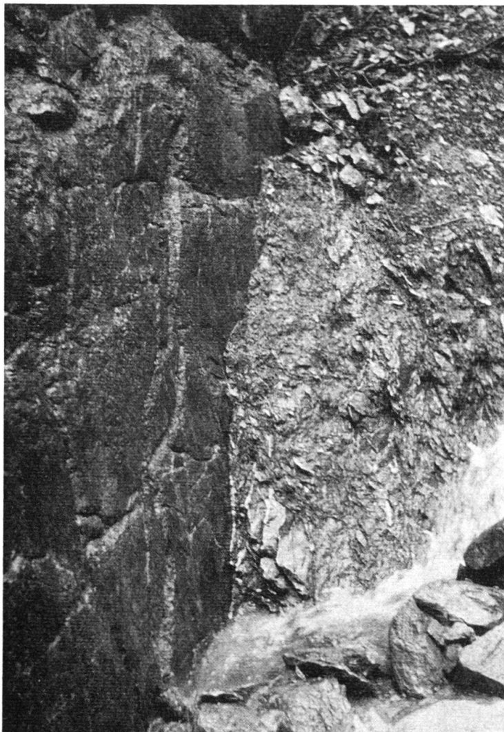
Fig. 13. A gauche formation siliceuse, à droite formation calcaréo-argileuse (Membre B). Contact par faille (voir aussi p. 687, § 5).

– Vers 1300 m, des «miches» sont enchâssées dans les schistes et les calcschistes; cette zone est broyée, elle annonce la faille visible à 1305 m, sur la rive droite (Fig. 13).