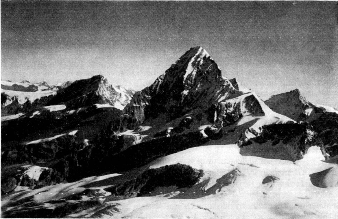
Fig. 8. Die Dentblanche von Südwesten.

Die solchermassen roh umrissene Dentblanche-Scholle eigener Prägung entfernt sich prinzipiell recht beträchtlich von dem Bilde, das HAGEN vor wenigen Jahren von einer solchen «Dentblanche-Scholle» entworfen hat. HAGENS Dentblanche-Scholle entspricht nur dem obersten Teil meiner Dentblanche-Scholle neuer Prägung. Unter seiner Dentblanche-Scholle unterschied HAGEN eine Sonder-scherbe des Mont Collon, unter dieser eine eigene Valpelline-Scholle. Im Grunde