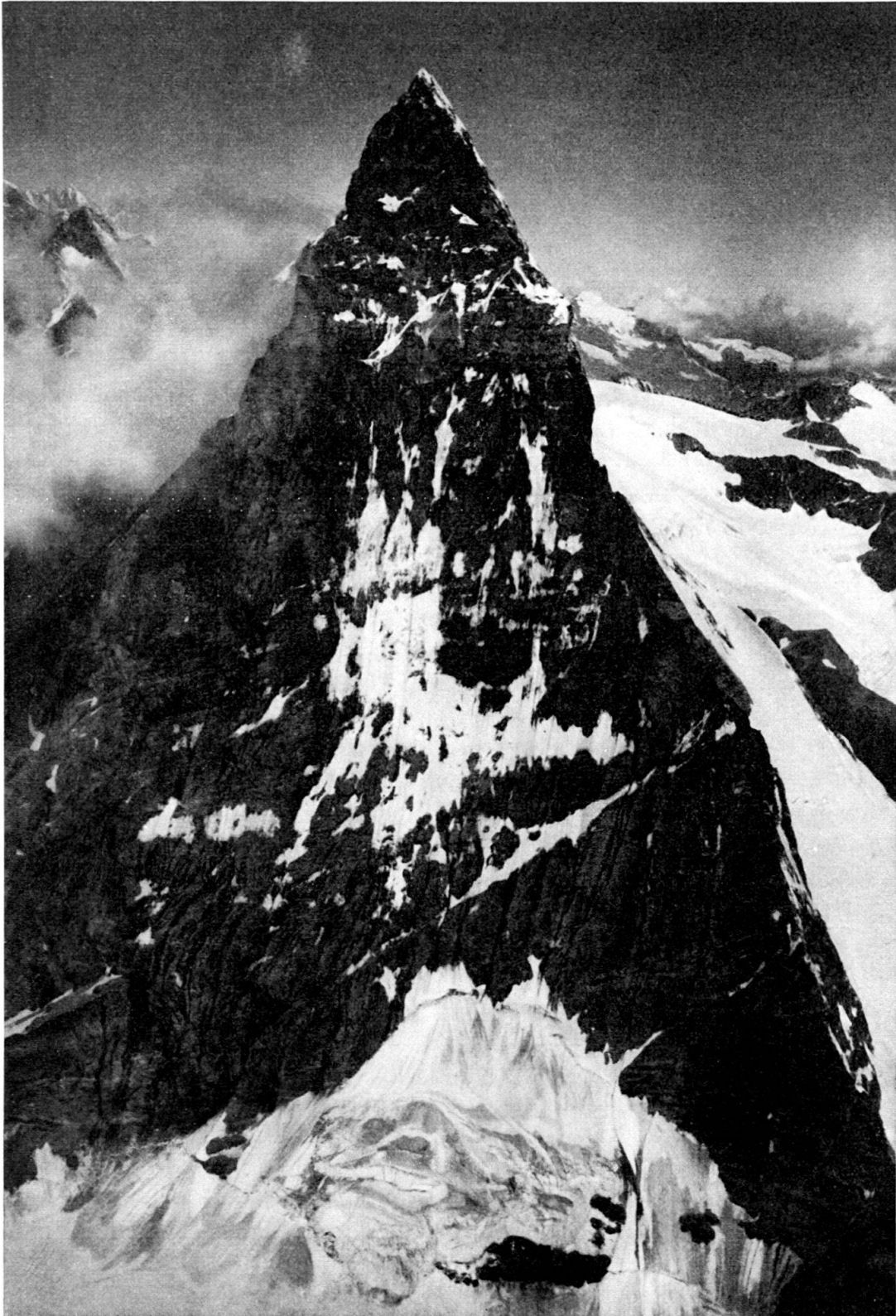
Fig. 3. Das Matterhorn von Osten.