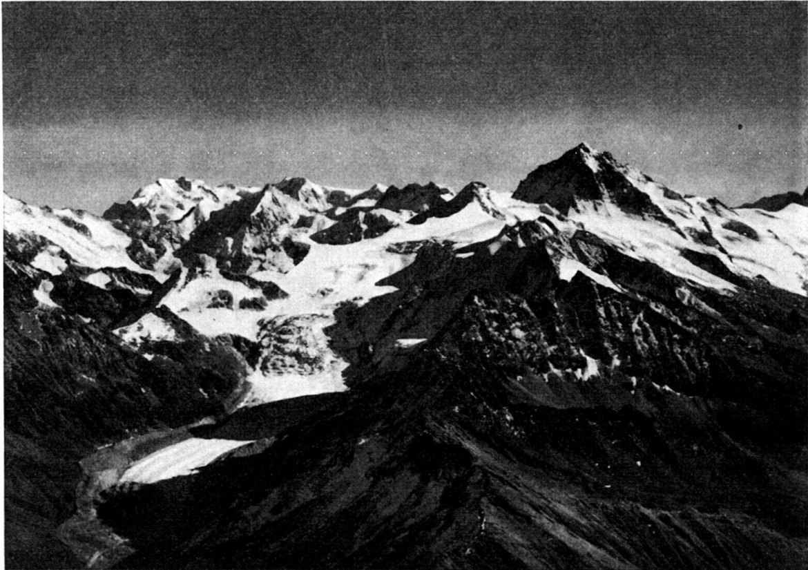
Fig. 9. Die Dentblanche von Nordwesten.

Prinzip gegen Norden aufsteigen. Die südliche dieser Scherflächen wäre im eben diskutierten Fall die Basis des Unterbaues der Dentblanche-Scholle, d. h. des eigentlichen Besso, die nördliche die Fuge zwischen einer stark reduzierten Tsa/Rothorn-Scholle und einem gleichfalls beträchtlich zusammengeschrumpften Weisshorn-Element. In den Nordabstürzen des Pigne de l'Allée sollten diese beiden Trennungen weiterziehen, doch ist darüber vorderhand nichts Näheres bekannt. Hingegen ermutigen die Verhältnisse zwischen Moiry und Ferpèche zu weiteren Studien in dieser Richtung, und zwar scheint sich dort recht deutlich folgendes herauszukristallisieren: