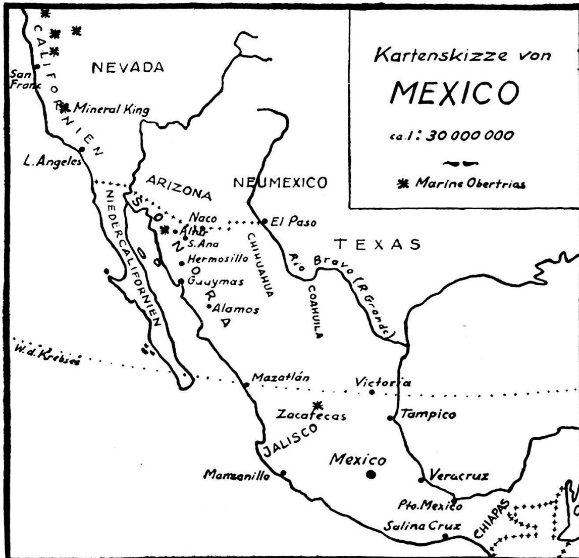
Figur 1. Kartenskizze von Mexico.

Die zacatekische Trias wird von BURCKHARDT der julischen Unterstufe des Carnien zugewiesen; SMITH (26) nimmt sie als Äquivalent seiner Trachycerasunterabteilung (s. o.), was beides einander ziemlich entsprechen dürfte. Demnach wären in Mexiko zwei Facies