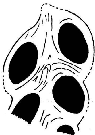
Fig. 2. Section longitudinale de Sequania Jurana sp. nov. Gr. nat. Les zones d'accroissement de la coquille et en particulier de la columelle et des sutures sont indiquées par les traits en noir.