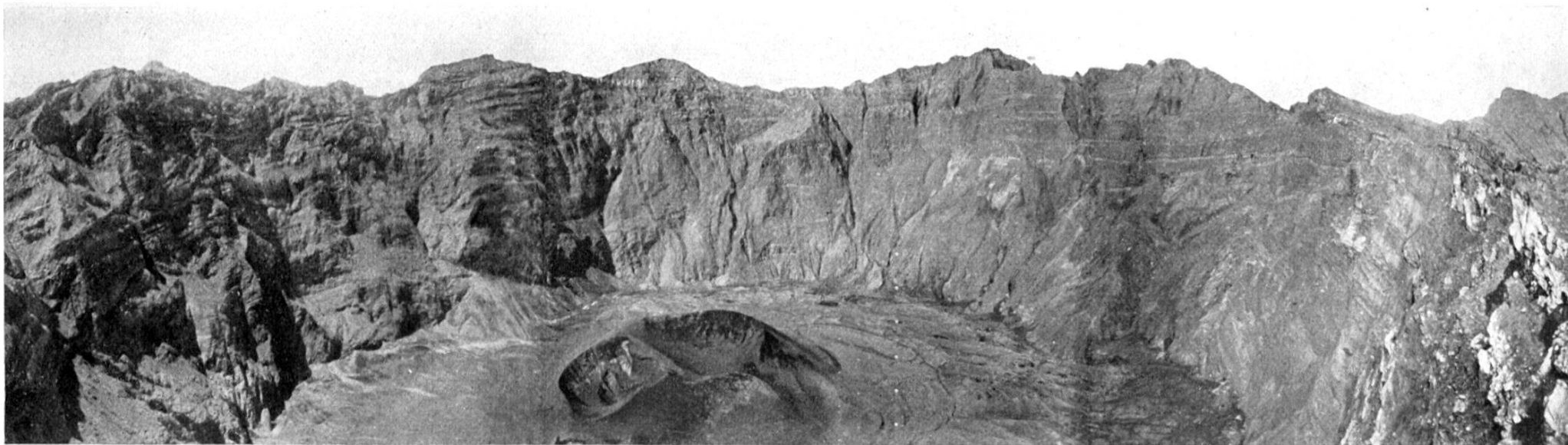
Phot. F. Weber, August 1917.