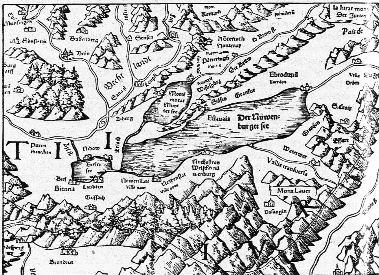
Spécimen de la carte de Tschudi (1538).

La naissance de la science géographique et de la cartographie date de l'époque des grandes découvertes : du XV e siècle.