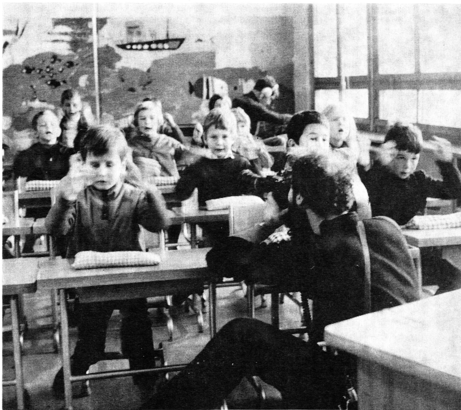
Tournage du film « Yvon Yvonne », présentant la méthode « Bon départ », dans une classe enfantine de Lausanne (voir en page 542)