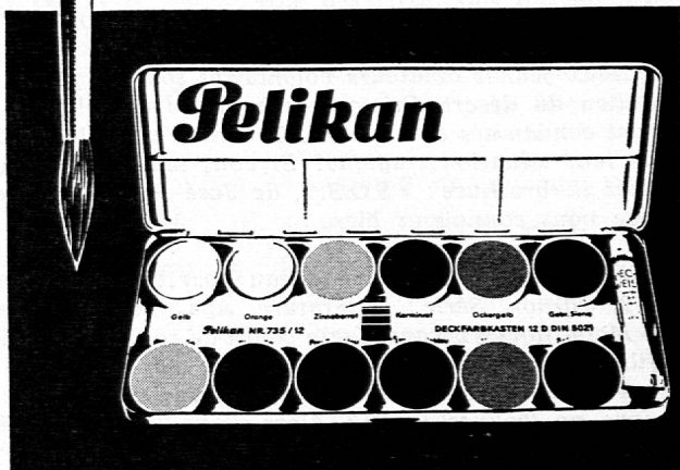
Günther Wagner AG - Pelikan-Werk - Zurich 38

Il est toujours difficile de convaincre par des paroles. Un essai pratique est préférable. Sur demande, nous enverrons volontiers aux maîtres de dessin une boîte de couleurs Pelikan 735/12 gratuite à titre d'échantillon.