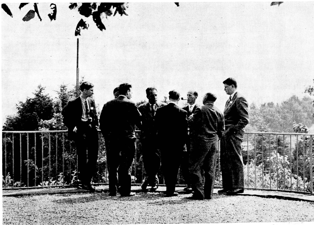
A Chexbres: Un colloque aussi calme que le paysage...

Rédacteurs responsables : Educateur, André CHABLOZ, Lausanne, Clochetons 9 ; Bulletin, G. WILLEMIN, Case postale 3, Genève-Cornavin. Administration, abonnements et annonces : IMPRIMERIE CORBAZ S.A., Montreux, place du Marché 7, téléphone 6 27 98. Chèques postaux II b 379 PRIX DE L'ABONNEMENT ANNUEL : SUISSE FR. 15.50 ; ÉTRANGER FR. 20.- • SUPPLÉMENT TRIMESTRIEL : BULLETIN BIBLIOGRAPHIQUE