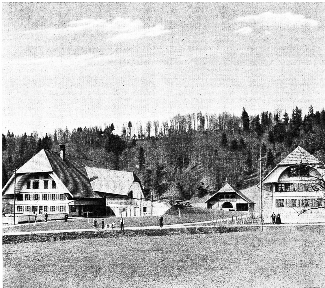
Maison paysanne, grange et « Stöckli » à Fürten

Rédacteurs responsables: Educateur, André CHABLOZ, Lausanne, Clochetons 9; Bulletin, G. WILLEMIN, Case postale 3, Genève-Cornavin. Administration, abonnements et annonces: IMPRIMERIE CORBAZ S.A., Montreux, place du Marché 7, téléphone 6 27 98. Chèques postaux II b 379 PRIX DE L'ABONNEMENT ANNUEL: SUISSE FR. 15.50; ÉTRANGER FR. 20.- • SUPPLÉMENT TRIMESTRIEL: BULLETIN BIBLIOGRAPHIQUE