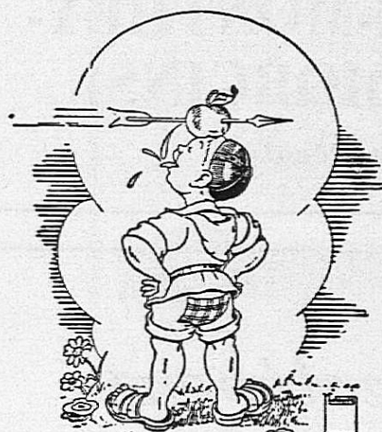
Chic!... du POMDOR CIDRERIE JYVERDON

Transports en Suisse et à l'étranger. Concess. de la Sté Vaud. de Crémation