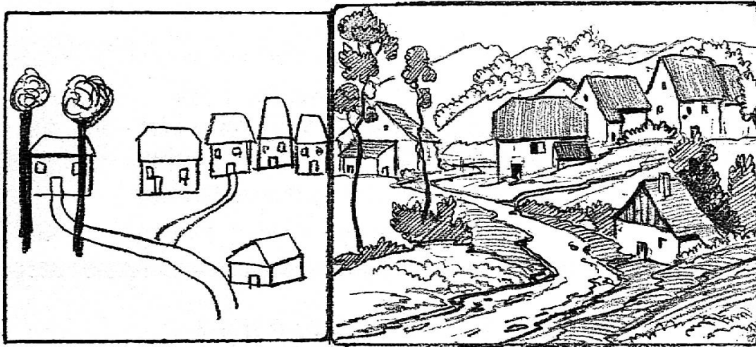
Fig. 267. — Dessin d'élève.