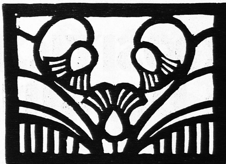
Fig. 6. Le travail au vaporisateur. Les surfaces blanches sont ajourées tandis que les noires formant chablon retiennent la couleur vaporisée.

Nous rappelons qu'en découpant un chablon il faut ménager des tenons qui empêchent les parties intérieures de tomber ou de se soulever pendant qu'on peint. Dans la fig. 5, nous donnons un exemple de chablon où les tenons