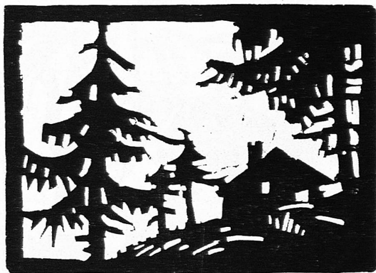
Fig. 4. Exemple de paysage traité en papier ajouré. Tous les éléments tiennent les uns aux autres et même au cadre.

Au lieu de coller sur un fond des motifs décoratifs découpés d'avance, on peut opérer d'une manière inverse : dessiner les motifs sur le fond, les découper en laissant entre eux des tenons , exactement comme pour un pochoir ; la seule différence avec le pochoir est que, au lieu de peindre les ajours, on colle sous le fond un papier de couleur ou même plusieurs papiers de couleur pour faire ressortir les différents éléments. Ainsi dans la fig. 2, 1 on peut coller