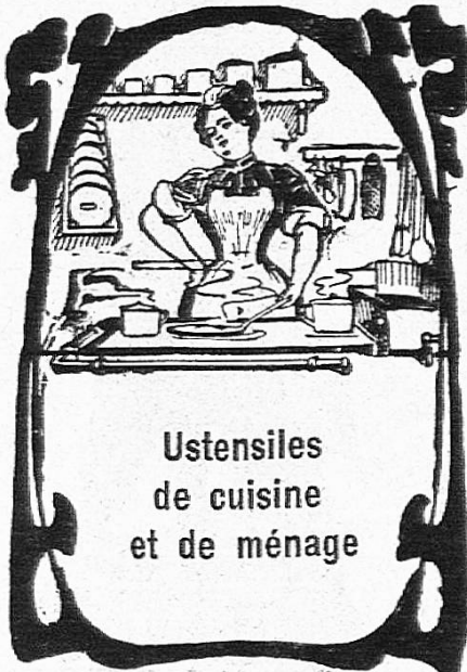
Ustensiles de cuisine et de ménage

S'adresser à MM. J. Schœchtelin , Agent général, Grand-Chêne 11, Lausanne.