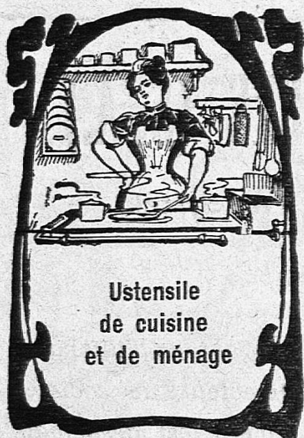
Ustensile de cuisine et de ménage