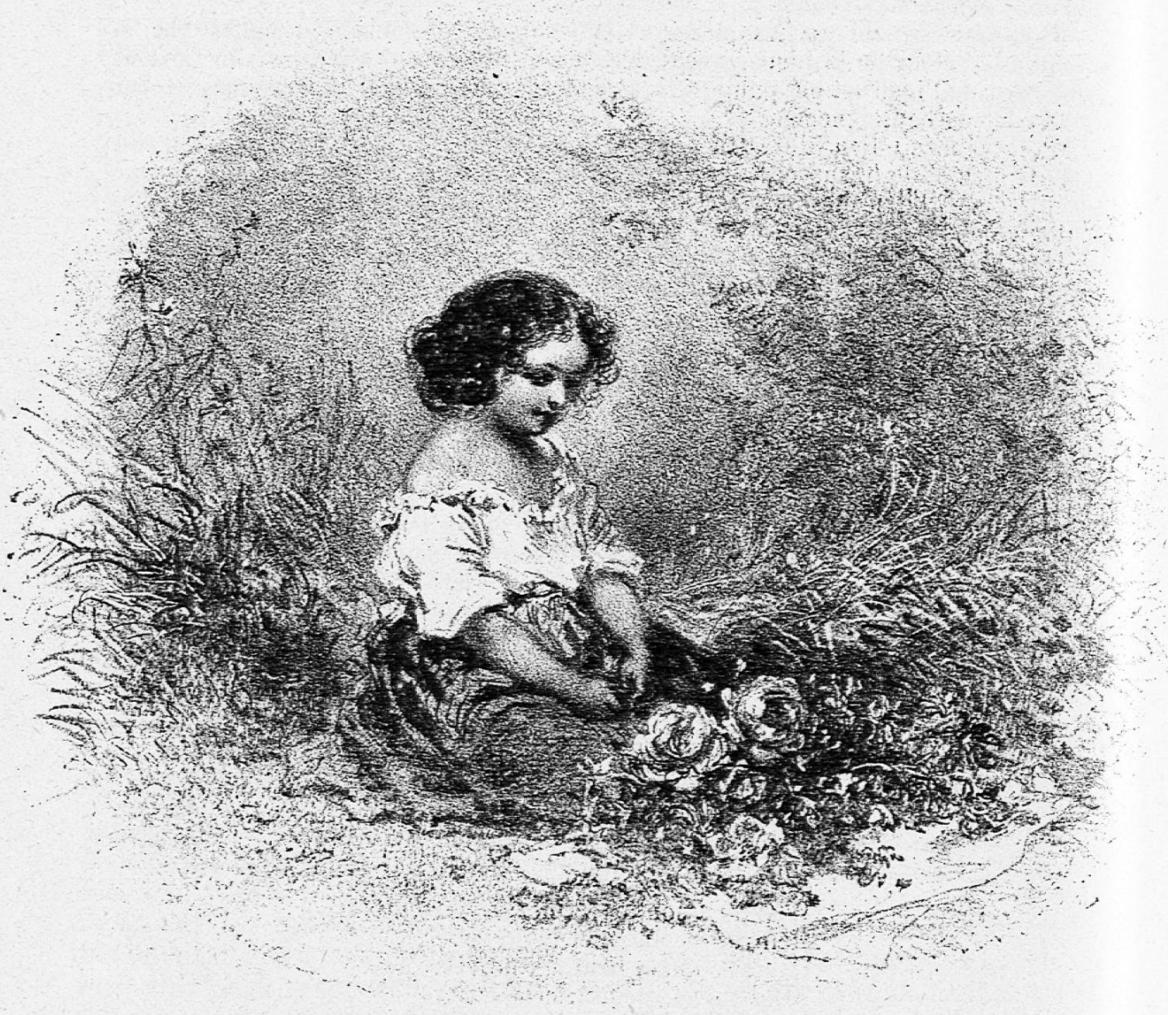
Moissons de fleurs.