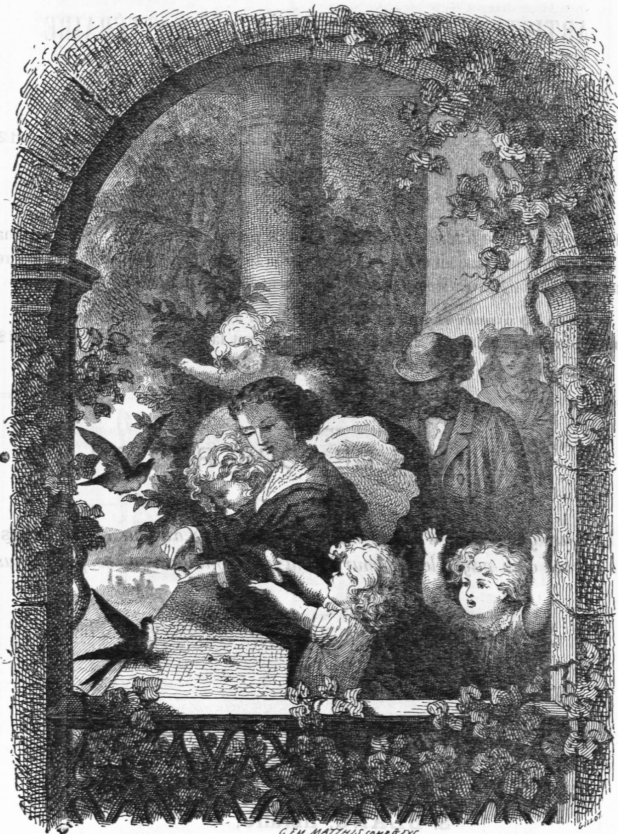
Voyage d'une hirondelle.