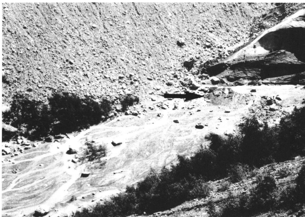
Fig. 1. — Le front du glacier des Bossons en août 1980.

devient peu à peu générale et qui n'est interrompue que par quelques petites poussées secondaires. A partir de 1955, le nombre des glaciers en retrait diminue. Beaucoup d'appareils deviennent stationnaires et certains sont en crue 7 . Entre 1975 et 1985 se produit une crue relativement importante. Certains glaciers du massif, qui réagissent particulièrement rapidement aux modifications de climat, épaississent et avancent fortement de 1978 à 1982. C'est le cas des glaciers des Bossons et d'Argentière. La zone frontale de ce dernier a tellement épaissi que, dès 1980, il a fallu creuser en permanence une tranchée dans la glace pour le passage de la benne du téléphérique d'EDF. Par la suite, un pylône du même téléphérique, situé au bord du glacier en rive gauche, a dû être déplacé. Les figures 1 et 2 montrent le maximum d'extension atteint par le glacier des Bossons en 1982 et illustrent la mobilité de ce front glaciaire. En août 1980 (fig. 1), l'extrémité de la langue glaciaire, étroite, touche presque une petite moraine frontale (flèche horizontale). Elle se situe à une vingtaine de mètres du bosquet qui borde le sandur en rive droite. En août 1982 (fig. 2), le glacier a atteint le bosquet et quelques arbustes ont été recou-