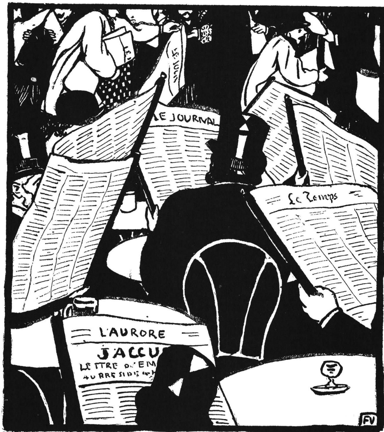
L'AGE DU PAPIER