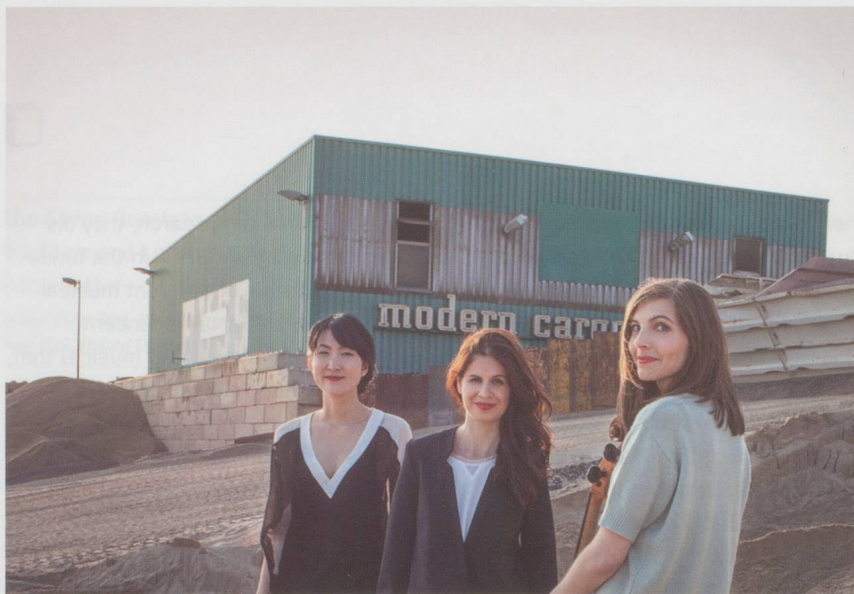
Trio Catch.

Melancholisch sehnsuchtsvoll trifft das folgende Klarinetten trio a-Moll op. 114 von Brahms genau in die unaufgeregte Stimmung, in die Sanh den Hörer entlassen hat. Mit grossem, körperlichem Ton gestalten die drei Musikerinnen die Melodien, die einfach aus sich selbst heraus zu fließen scheinen. Durch die klar differenzierten dynamischen Feinstufungen wird Brahms' populäres Werk zu einem spannungsvol-