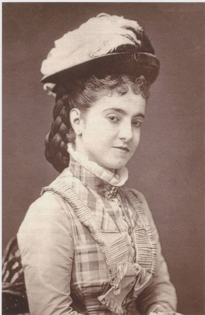
Die gefeierte Sopranistin Adelina Patti (1843–1919).

auch in Partituren und Klavierauszügen abgedruckt. Das 1848 komponierte Violinkonzert op. 30 des deutschen Violinvirtuosen und Komponisten Bernhard Molique beispielsweise, das grosse Ähnlichkeiten mit Mendelssohns etwa gleichzeitig entstandenen Violinkonzert aufweist, enthält solche Portamento-Bezeichnungen im Klavierauszug (Abb. 3). Die ernste, elegische Melodie ist in den Takten 4, 8 und 9 im Original mit zwei aufeinander folgenden Ziffern bezeichnet, die einen «fortgleitenden» Lagenwechsel mit dem gleichen Finger anzeigen. Dennoch sind die Ausdrucksmittel nur für kundige Streicher lesbar, denn den notierten Lagenwechseln geht jeweils ein weiteres Portamento voraus, dessen Fingersatz nur aus dem Zusammenhang erkennbar ist (rot eingezeichnet).