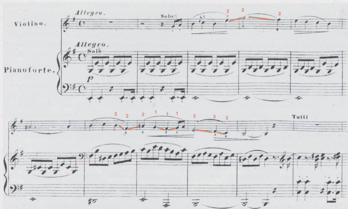
Abb. 3: Bernhard Molique, Violinkonzert Nr. 6, e-Moll op. 30 (1848), Erstdruck