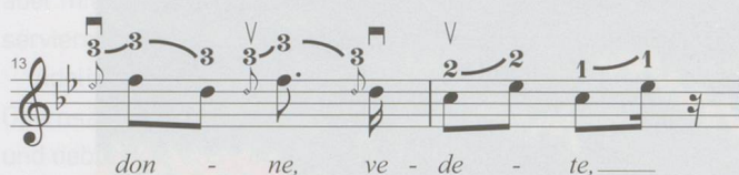
Abb. 6: Übertragung der Takte 13–14 in Violin-Fingersätze.

zeitgenössischen Geigers lassen sich die von Patti eingesetzten Techniken nämlich in eindeutig definierte technische Chiffren übertragen (Abb. 6): Beide Intervalle werden durch «Fortgleiten» mit dem gleichen Finger ausgeführt, wobei der Anfangston jeweils von unten «aufgesucht» wird. Im zweiten Terzintervall von T. 13 findet der Bogenwechsel (in Analogie zum Silbenwechsel) erst nach dem Erreichen der tiefen Intervallstufe statt – der Bogenwechsel wird durch das Erreichen des Intonationsziels also antizipiert. In T. 14 werden beide aufwärts geführten Terzintervalle mit jeweils einem Finger gespielt. Dazwischen findet keine gegenläufige Bewegung statt, darum werden zwei verschiedene Finger für das wiederholte «Fortgleiten» eingesetzt, wie der folgende Fingersatzvorschlag veranschaulicht: