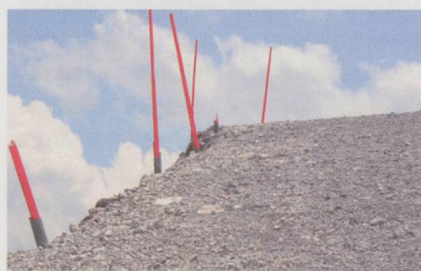
Ein Höhenweg (Detail des CD-Covers).

See Siang Wong (Klavier) Guild GMCD 7318