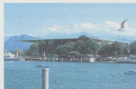
Fehlende Distanz? Das KKL Luzern, ein Austragungsort des Schweizer Tonkünstlerfests 2010.