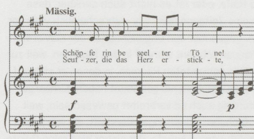
An die Harmonie D 394

Freilich, die Häufigkeit der Beispiele ist noch lange kein Beweis gegen Kirnberger II. Es ist uns durchaus bewusst, dass wir aus solchen satztechnischen Aspekten keine gesicherten Aussagen über die Temperatur des schubertschen Klaviers destillieren können. Aber angesichts der sehr exponierten Situation eines Liedbeginns ist es doch erstaunlich, wie häufig Schubert gerade jene harmonische Situation forciert, die in Kirnberger II eher problematisch zu sein scheint. Man müsste selbstverständlich den jeweiligen Gedicht-Text in die Untersuchung mit einbeziehen, um wenigstens darüber spekulieren zu können, inwieweit Schubert sich jeweils bewusst und aus künstlerischen Überlegungen heraus für einen instabilen, schwebenden Tonika-Klang entscheidet. Und auch wenn der zeitliche Rahmen unseres Forschungsprojektes nur einen oberflächlichen Blick darauf zugelassen hat, so scheint A-Dur zumindest nicht für eine ganz bestimmte Ausdruckssphäre zu stehen, zumal die entsprechenden Gedicht-Vorlagen inhaltlich relativ heterogen