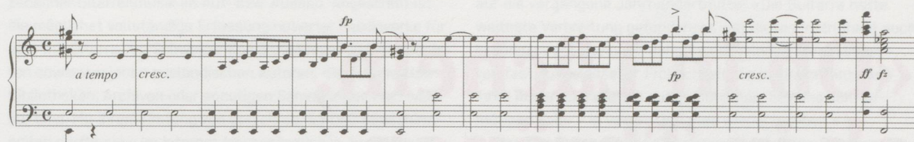
Franz Schubert, Klaviersonate a-Moll, D 845, 1825, I. Moderato, T. 10-20.